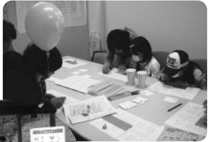
▲点訳で名刺づくり (くるみの会)