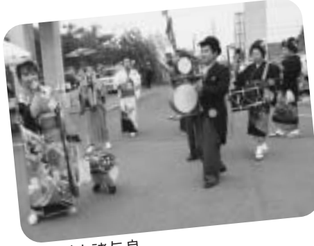
▲信州小諸与良チンドンバンドの演奏流し