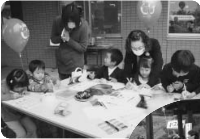
▲プラバンキーホルダー作り (㈱ファンケル発芽玄米の皆さん)