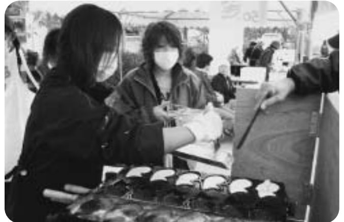
▲たい焼きコーナー（ちいさがた福祉会）