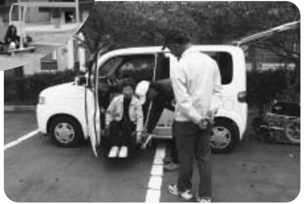
▲福祉車両体験コーナー