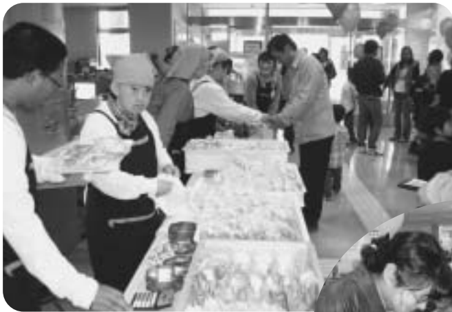
▲ダーチャのパン販売