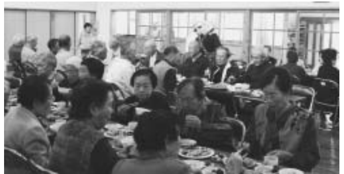
男性もたくさん参加しました