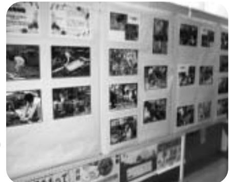
▲パネル展示（根っこの会）