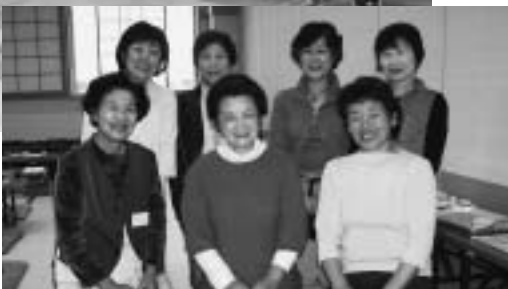
みんなで協力して生き生きサロンを運営しています