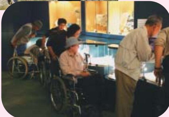
▲障がい者希望の旅「いい旅ときめき隊」