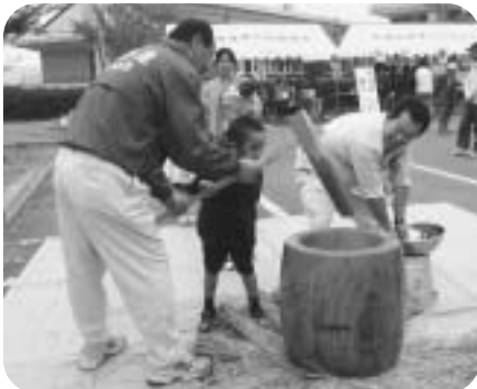
▲餅つき体験道場（実行委員会）