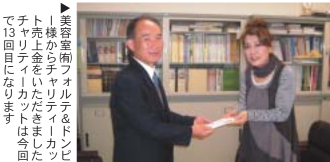
美容室(有)フォルテ&ドンピー様からチャリティーカードをいただきました。第13回チャリティーカット売上金……80,000円