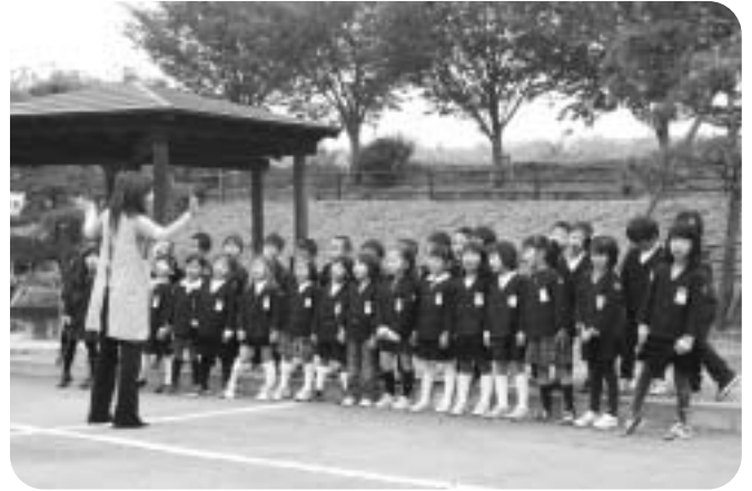
▲「くるみ幼稚園」園児の合唱（オープニング）