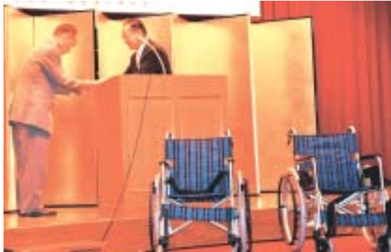
道の駅「雷電くるみの里」様から車イス2台をいただきました