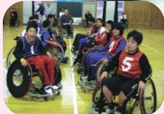
▲ 祢津小学校福祉体験学習の「ツインバスケット」