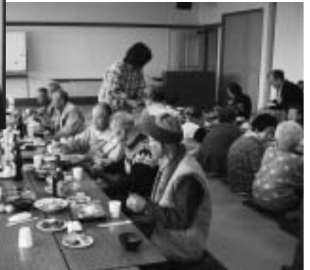
御牧原北部の生き生きサロン