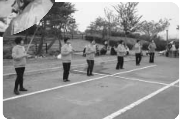
▲手話ダンス (サンフラワーズ)