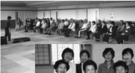
足腰 シャン シャン 教室

生き生きサロンは毎月1回開催しており、毎回50人位が訪れます。保健補導員と福祉運営委員、民生委員らが中心となり企画、“輪”を広げています。