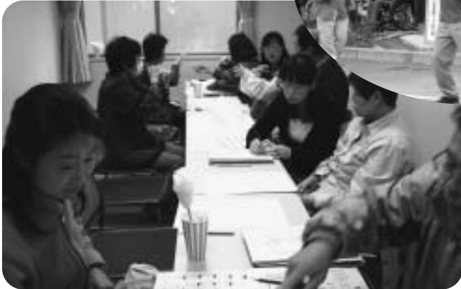
▲手話体験 (もみじ・手のひらの会)