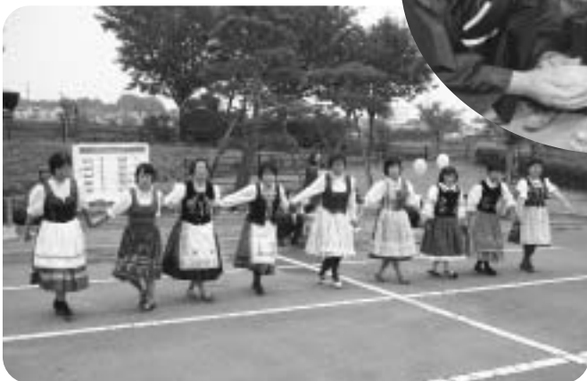
▲フォークダンス (乙女平フォークダンス愛好会)