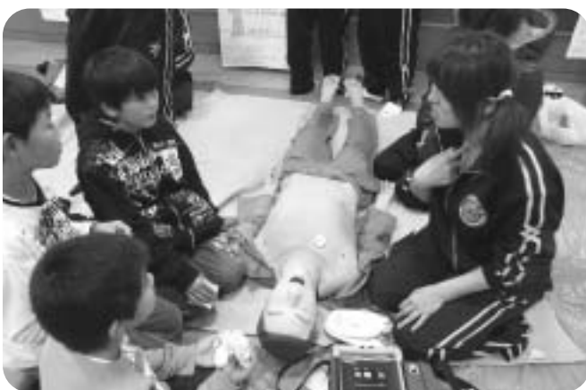
▲AED体験（長野救命医療専門学校）