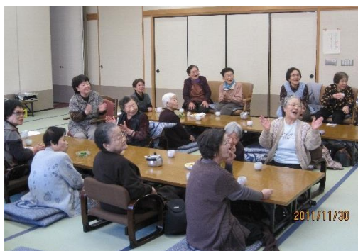
◀ サロンでわいわいお茶会