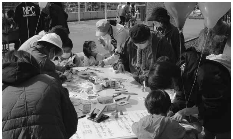
▲プラ板工作コーナー