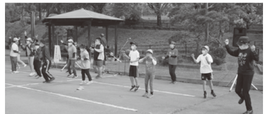
▲ふれあいステージ発表(ダンスグループ「からふる」)