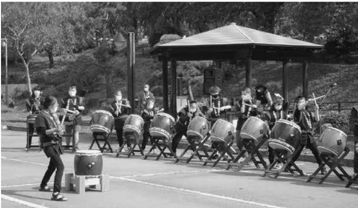
▲オープニングセレモニー（「スキップ」の太鼓演奏）