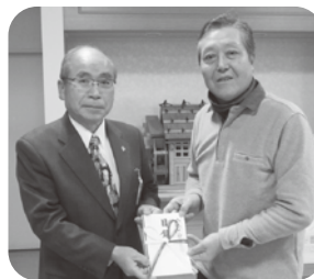
▲東御キリスト教会様