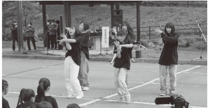
▲ふれあいステージ発表 (studio D・D・D)