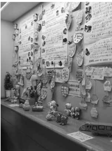
▲NPO法人「ひまわりの丘」の展示