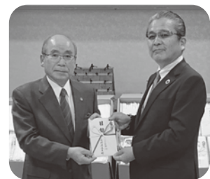
▲こくみん共済coop長野推進本部様