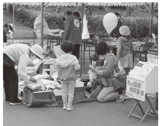
▲被災地支援バザー