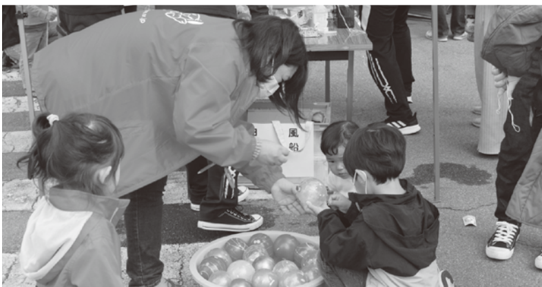
▲ヨーヨーつり体験