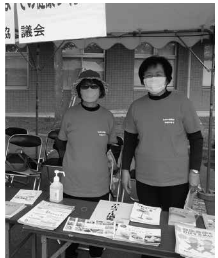
▲食生活改善推進協議会コーナー