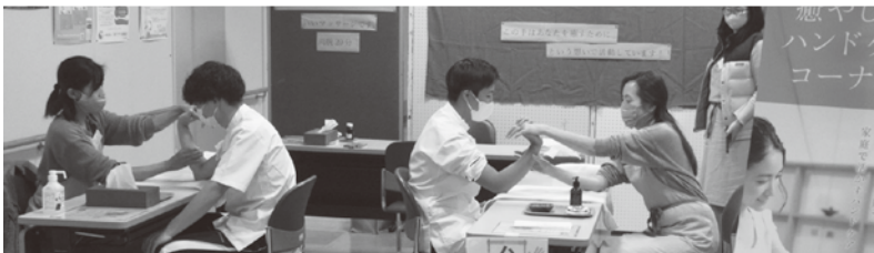
▲ハンドマッサージ