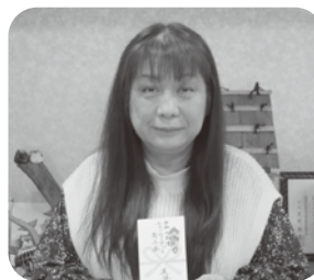
▲美容室フォルテ様