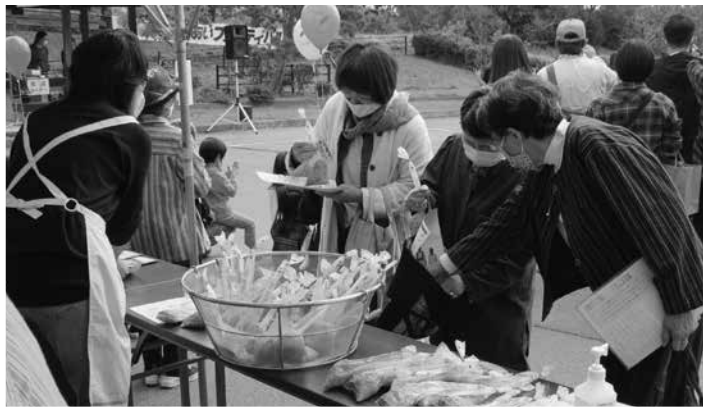
▲赤十字奉仕団コーナー