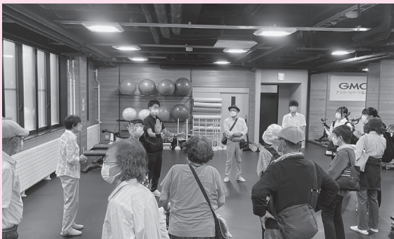
▲ ボラ連主催の「楽しく交流する会」の様子