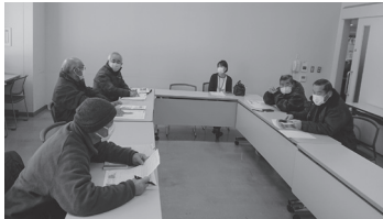
総合福祉センターで (メンバーが送迎)