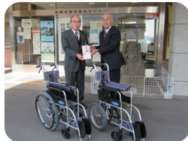
▲道の駅(有)雷電くるみの里様