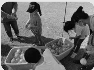
▲ 子どもだれでも居場所「くる me」