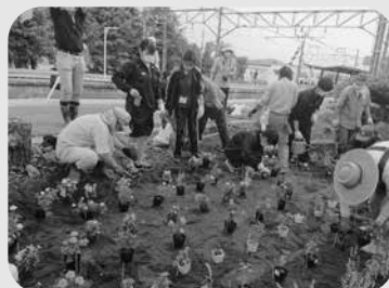
▲ はーべすとのかい