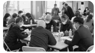
▲ 地区別地域福祉懇談会

社協は、地域住民の皆さんに会員としてご参加いただき、地域福祉活動を推進していく組織です。様々な事情により、自ら福祉活動に参加できない皆さんの善意の気持ちも、社協が形に変えて地域へお届けします。社協の4つの係がそれぞれ、地域の皆さんと共に活動しています。