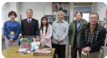
▲市民まちづくり会議 様