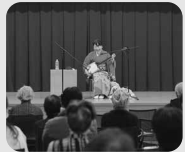
▲ 障がい者福祉のつどい