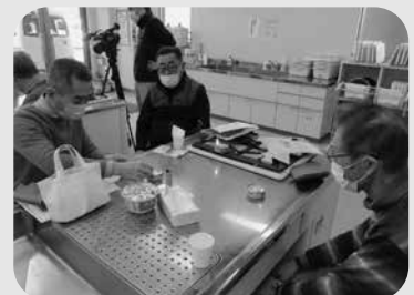
▲ とうみ男の遊び塾