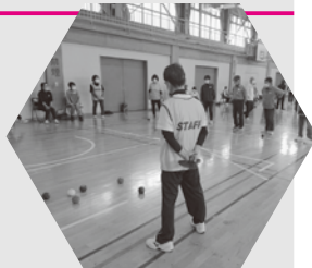
▲ 福祉団体交流会 (ポッチャ)