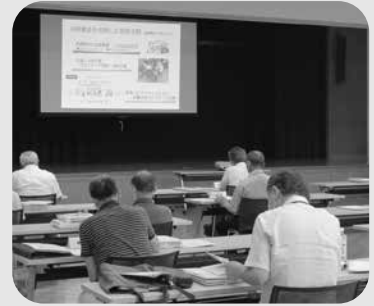
▲ 支部長会議（会費収納会議）