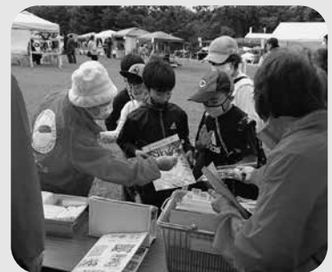
▲ 赤い羽根共同募金