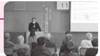
▲ 介護の日・福祉講演会