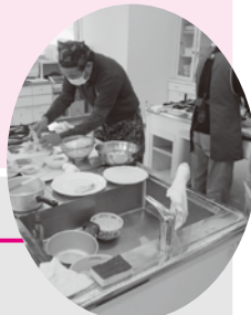
▲ 男性の料理サロン