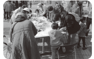
▲ 福祉の森ふれあいフェスティバル