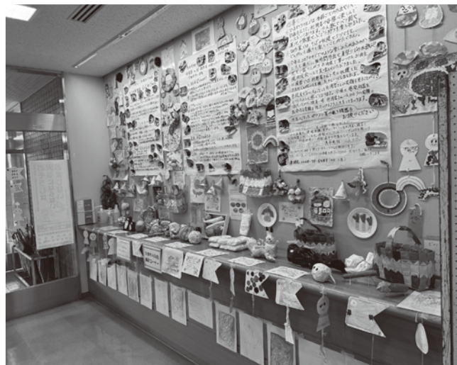
▲「ひまわりの丘」展示コーナーも…