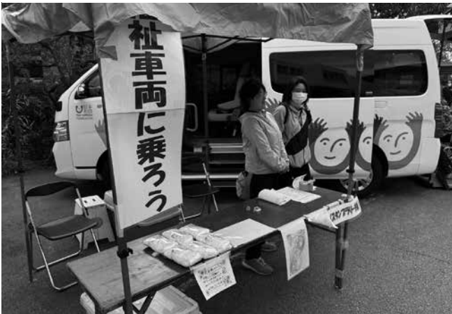
▲福祉車両の体験コーナー