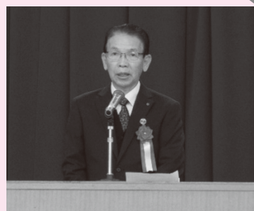
▲ご来賓の掛川副市長のごあいさつ