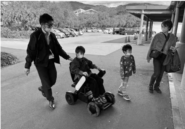
▲福祉用具の体験コーナー