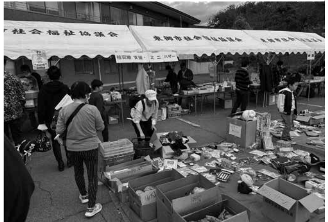
▲被災地支援バザー