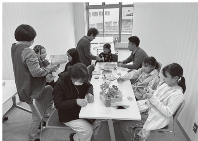
▲子どもたちに人気「折り紙体験コーナー」