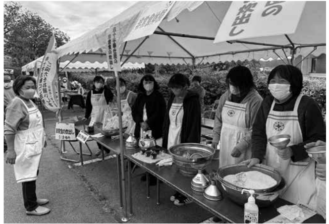
▲非常食づくり体験（赤十字奉仕団）