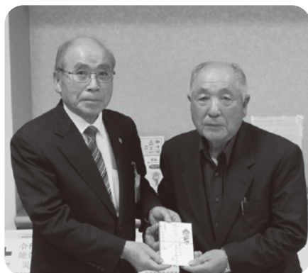
▲東和15年会平成15年和地区長会一同様