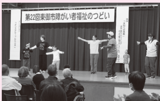
▲からふるによるダンスの披露