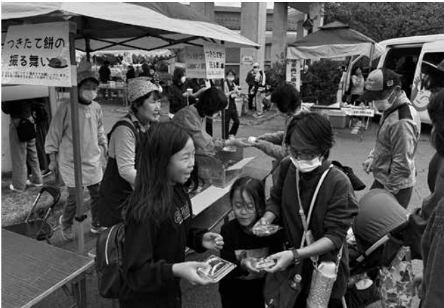
▲「お餅の振る舞い」には多くの人…