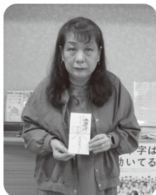
▲美容室フォルテ様