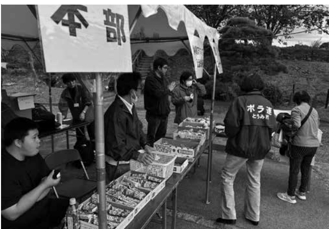
▲本部では景品交換が…