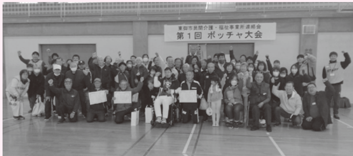
▲参加者全員で集合写真

11月16日、東御市民間介護・福祉事業所連絡会が主催する「第1回ボッチャ大会」が開催されました。この日は約100人以上が参加。介護・福祉事業所からの参加はもちろん、一般企業・一般市民からも多くの参加があり、参加チーム数は24チーム。普段顔を合わせることのない参加者同士ですが、ボッチャを通じてつながりを感じられる一日となりました。