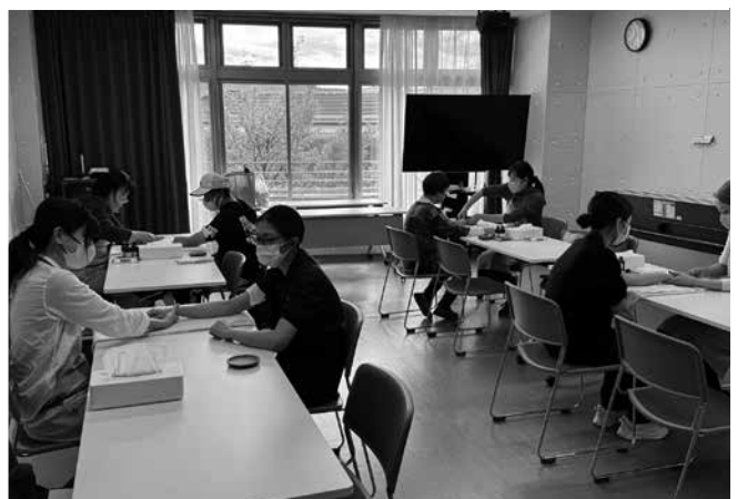
▲ハンドマッサージは人気！