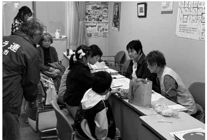
▲子どもたちが手話体験