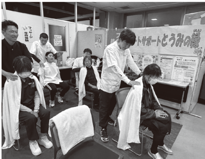
▲マッサージ手技体験（長野救命医療専門学校）