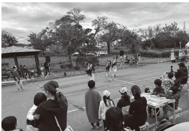
▲ステージ発表する「ダンス・スピリッツ」