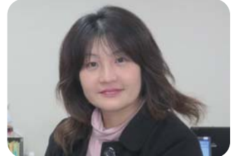
▲くるみ幼稚園保護者会様