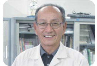
▲日信工業㈱東部工場様