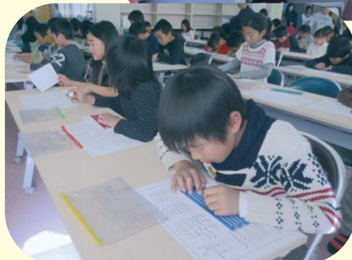
▲ 点字体験 (滋野小学校)