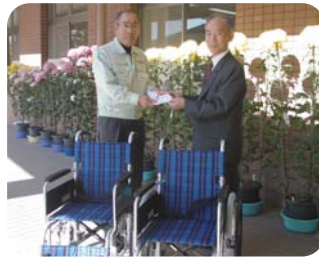
▲尙雷電くるみの里様