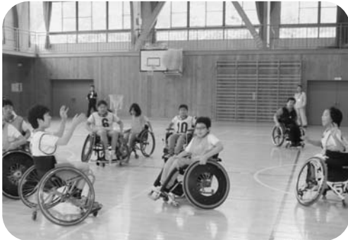
▶車いす （6年生） ツインバスケット