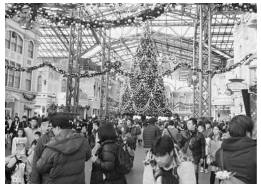
ディズニーランドで楽しむ参加者