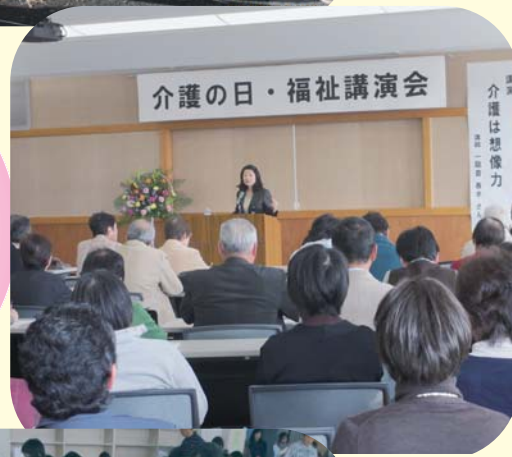
▲ 介護の日・福祉講演会