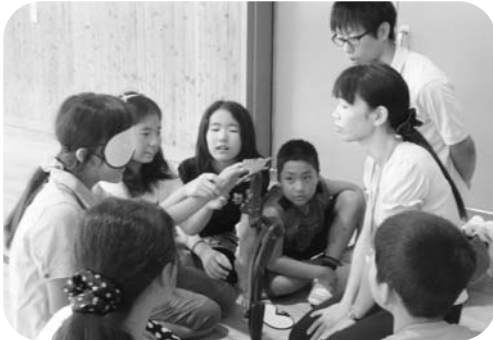
▶アイマスク （5年生） 対話型観賞