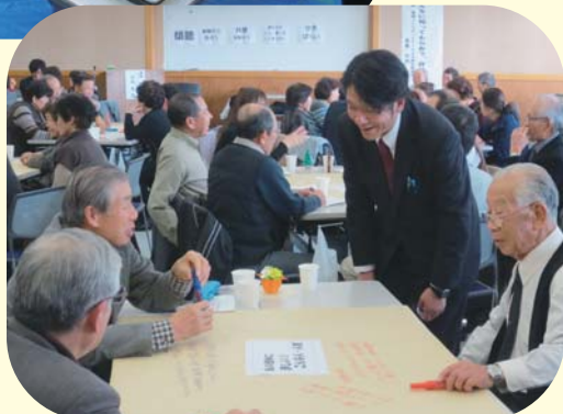
▲ 上小ブロック・ボランティアフォーラム