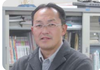
▲東御キリスト教会様