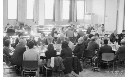
▲昨年の地域福祉懇談会