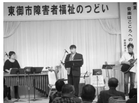
講演は「音楽はこころへのおくりもの」と題して演奏も…