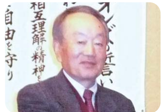
▲東御ライオンズクラブ様