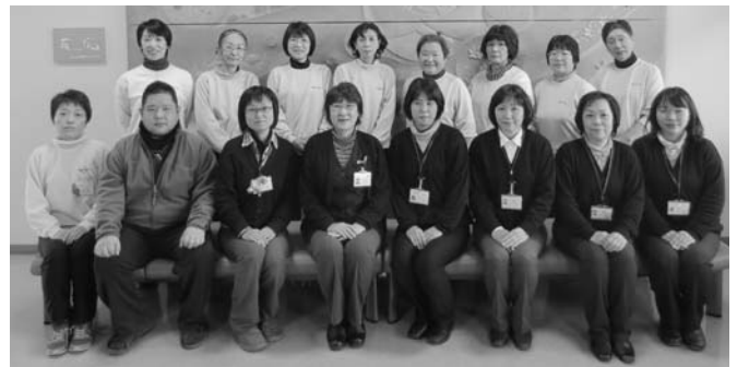
▲介護支援係・介護サービス係