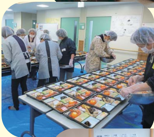
▲ おせち料理訪問事業