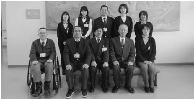
▲総務係・地域福祉係

結びに、新しい年が皆様にとって明るく幸せな年となりますようお祈り申し上げ、新年のあいさついたします。