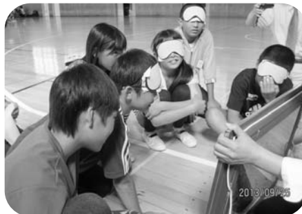
▲アイマスク体験 ～対話型鑑賞～（6年生）