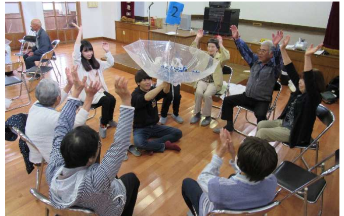
▲ 市内で開催されたサロンの様子（コロナ蔓延以前）

少人数でも、継続することが大切だと考えています。「地域に、地域の人同士が顔を合わせられる場所がある」ことが地域力UPにつながります。