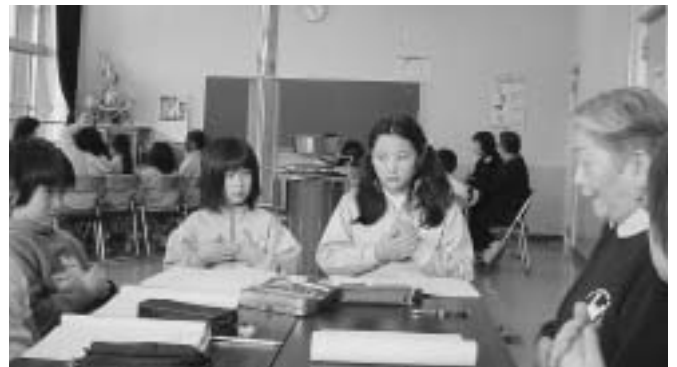
もしも、私が耳が聴こえなくなったら、とても助かります