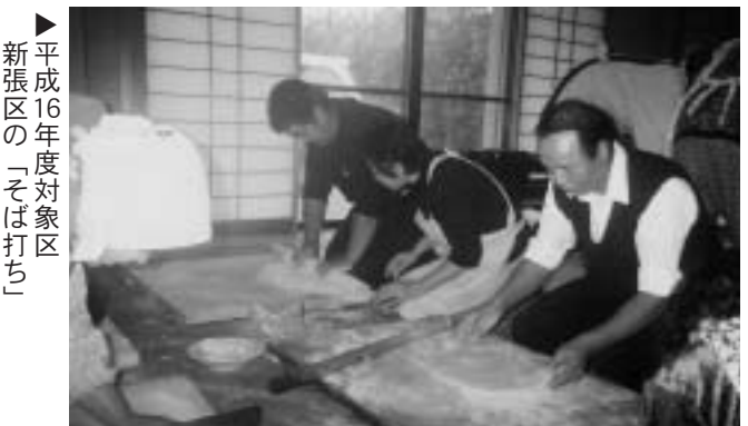
▶平成16年度対象区 新張区の「そば打ち」