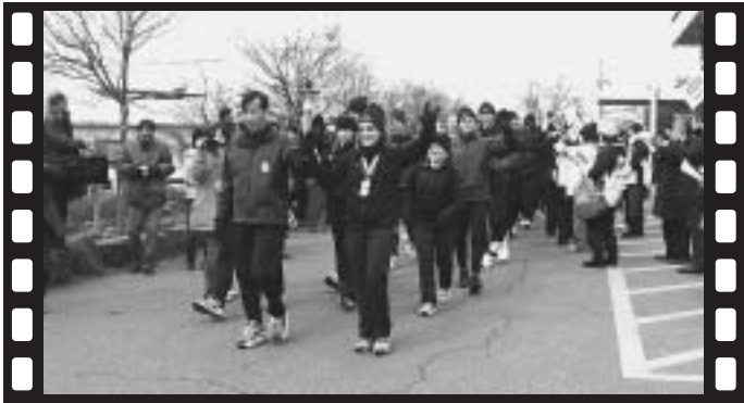
▲出発は東御市役所でした

応援に来たという市内の婦人は「こんな楽しい応援はめったにないことです。みんな頑張ってくれるといいですね」と、SOの旗を元気いっぱい振っていました。