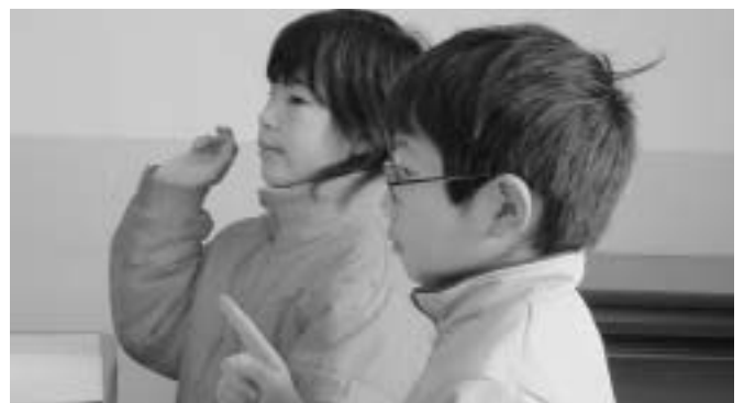
手話がとても大切なことを教わりました