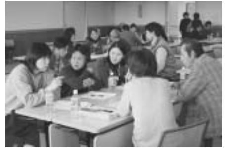
▲地域福祉について考えました(祢津地区)