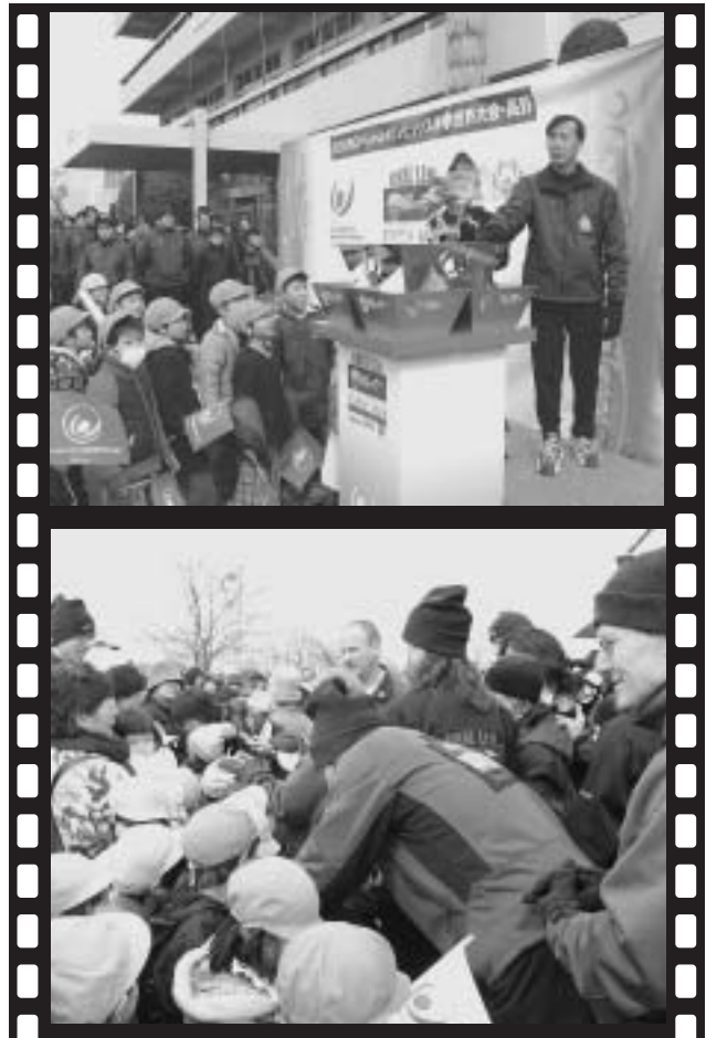
◀市内の子どもたちもトーチランに参加しました