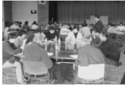
▲各区に別れて懇談(田中地区)