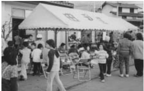
▶平成16年度対象区 田沢区のおらほ文化祭