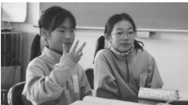
手の向きを変えるだけで色々な表現ができることを分かった