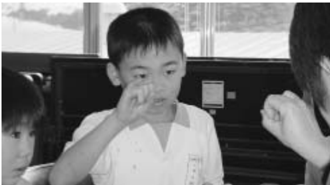
耳の不自由な人のためになるという夢が一つ増えました

◇やっぱり、本当の人たちとやることで、なんか、自分たちが、こんないい体でうまれてきてよかったな と思い、ちょっと悲しくなりました。でもあんなに元気そうにしているみなさんを見ていると、なんだ か、「すごいな～」と思います。みなさんの笑顔を見ていると、元気になるそうです。これからも、ガ んばって下さい。