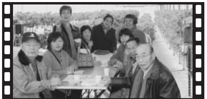
▲布引イチゴ園にて

2月19・20日に、日頃在宅で介護している人、8人が参加して介護者リフレッシュツアーが開催されました。1日目は佐久一萬里温泉のホテルでゆっくり温泉につかり参加者同士、交流を深めました。2日目は布引イチゴ園でイチゴ狩りを楽しんでもらい、寅さん記念館を見学してきました。温泉とイチゴを堪能した2日間でした。