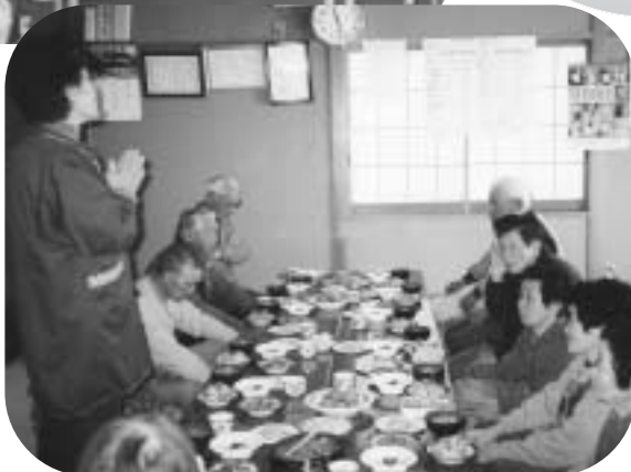
▲いきいきサロン楽しいひととき (田沢)