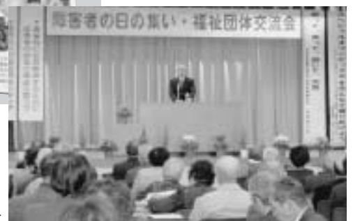
障害者の日の集い▶