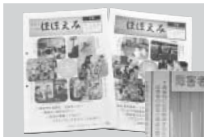
◀社協報“ほほえみ”発行