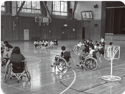
▲北御牧小「ツインバスケット体験」

令和5年度、市内の学校で計16回の福祉体験学習が開催されました。この学習は、児童・生徒が地域の障がい当事者やボランティアの協力を得ながら、地域の福祉に関心を寄せ、地域に暮らす人が抱える課題に気づき、地域のこれからを共に考えていくことを目的に、学校と協力し、開催しているものです。