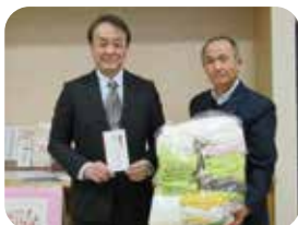
▲理容組合上小支部様