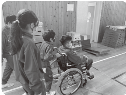
▲柵津小「車いす体験」