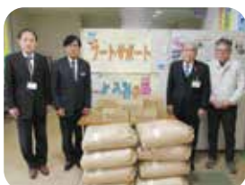
▲信州うえだ農業協同組合様