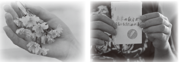
プログラムの活動より

ご家族や関係者からの相談・見学もお受けしています。また、グループを側面的にサポートしてくれるボランティアさんも募集中です。