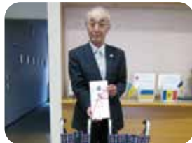
▲道の駅(有)雷電くるみの里様