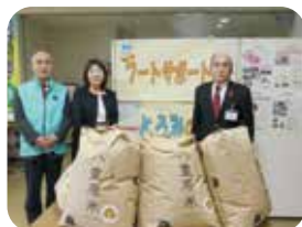
▲東御ライオンズクラブ様