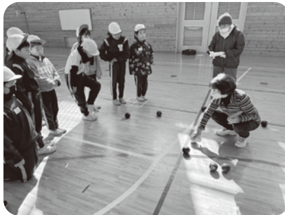
▲田中小「ボッチャ体験」