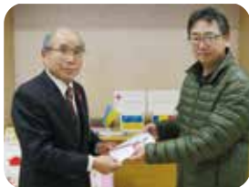
▲(株)ヴィラテストワイナリー様