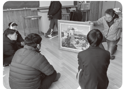
▲東御清翔高「対話型鑑賞」